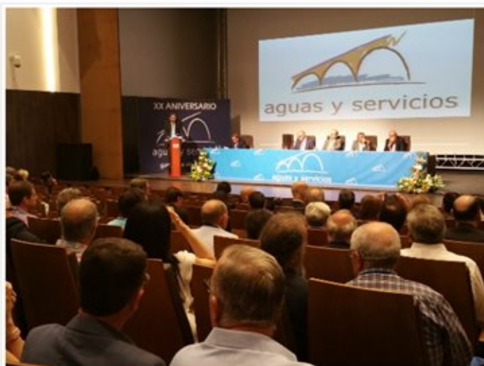
JORNADA CONMEMORATIVA DE LA EMPRESA 'AGUAS Y SERVICIOS'

En este encuentro la empresa, Aguas y Servicios de la Costa Tropical de Granada AIE, reconoce la labor a empleados, gerentes de aguas y servicios, gerentes de Mancomunidad de Municipios de la Costa Tropical de Granada y presidentes de la Mancomunidad de Municipios de la Costa Tropical.