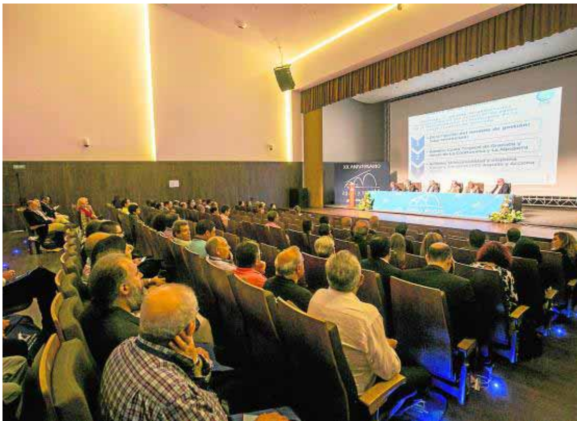
El público llenó el salón de conferencias del CDT de Motril.

Aguas y servicios celebra su XX aniversario con un evento en el CDT donde se reconoció el trabajo de varios empleados