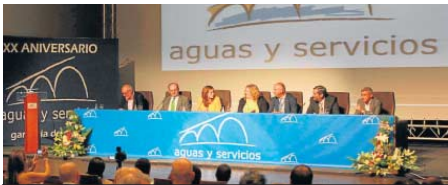
Las autoridades políticas y miembros de la empresa en el escenario durante el evento.